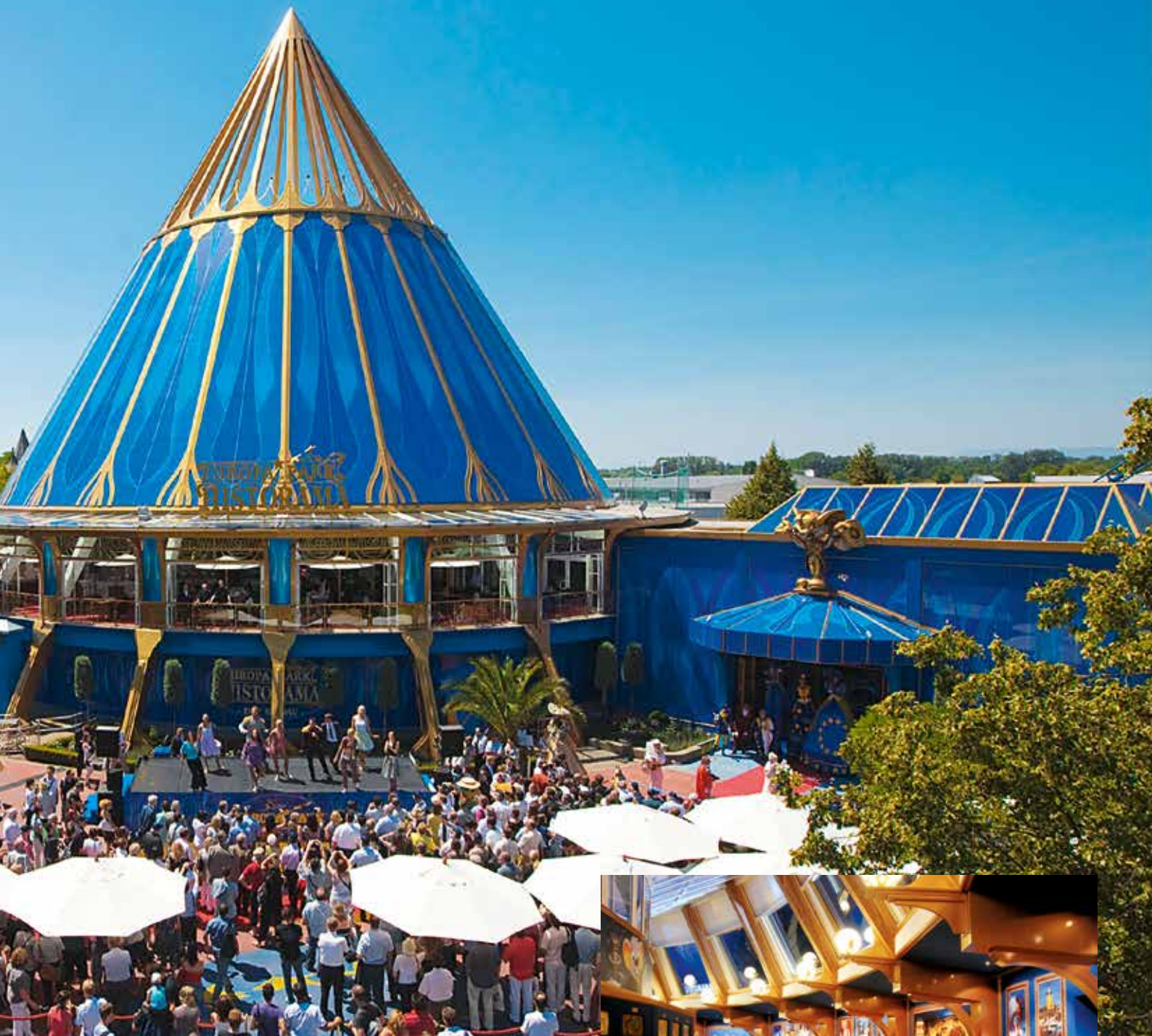
Referenz: Der Capalac EffektLack im Farbton „Pyramidengold“ verleiht dem „Historama“ im Europa-Park bei Rust besonderen Glanz.