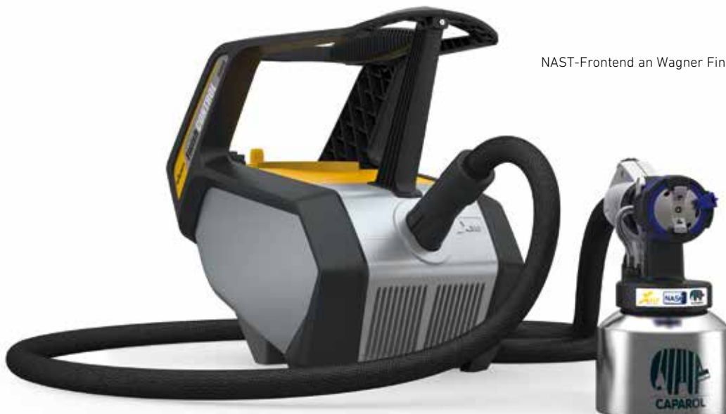
NAST-Frontend an Wagner Finish Control5000