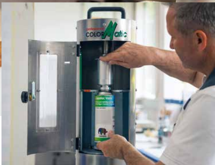
Sprüh Dosen-Befüllstation Capalac ColorMatic VitoMat I zum einfachen, individuellen Befüllen lösemittelhaltiger Lacke per Hand.