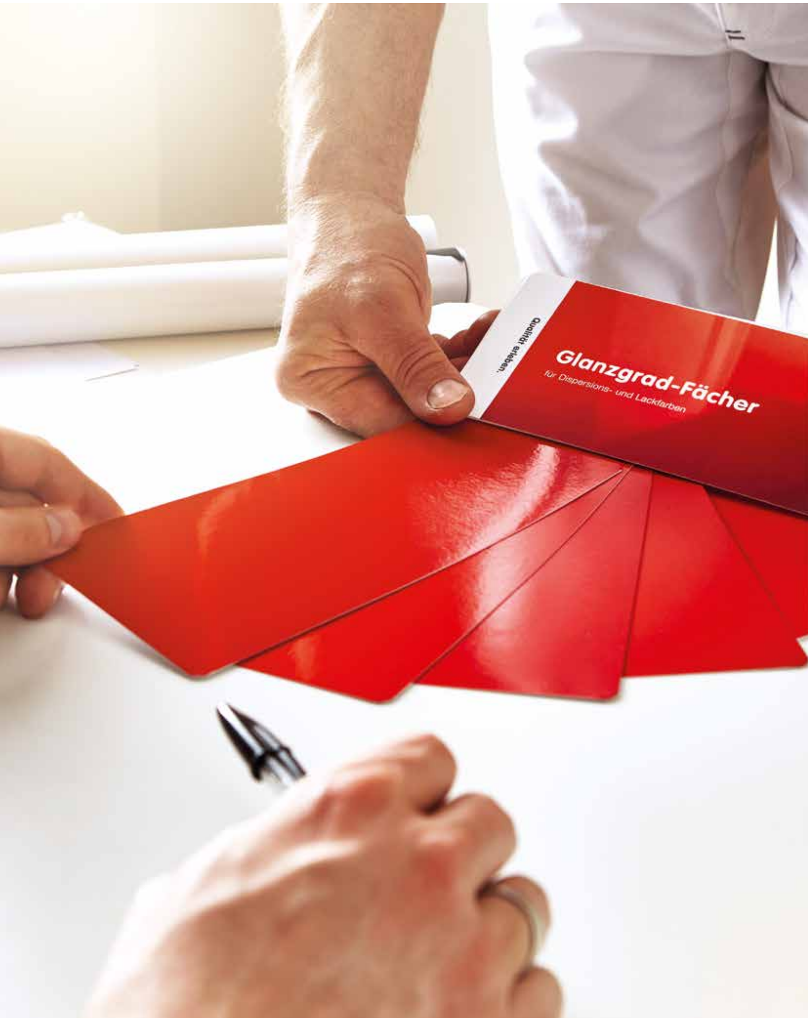
Immer zur Hand: Mit dem Caparol Glanzgrad-Fächer lassen sich neun unterschiedliche Glanzgrade sofort visualisieren.