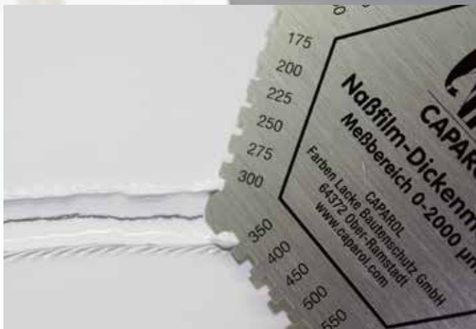
Capacryl Spray-TEC-Satin: schneller und rationeller Spritzauftrag mit hohem Standvermögen bis 250 µm Nassschichtdicke.