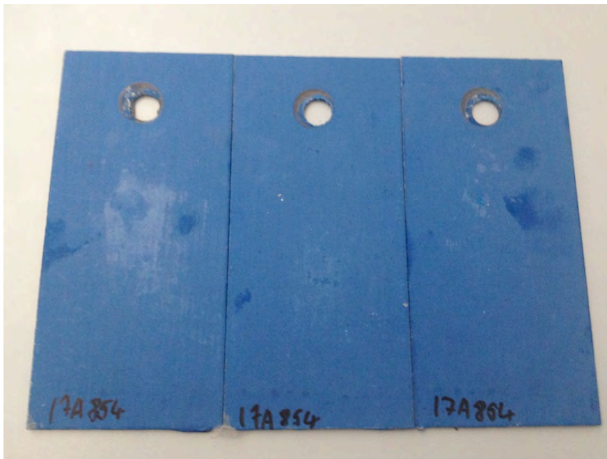
Bild 3 – Gesweepete feuerverzinkte Bleche / Capalac Dickschichtlack Unifarbtan RAL 5010

Auftraggeber: Caparol Farbe, Lack und Bautenschutz GmbH / Roßdörferstraße 50 / 64372 Ober-Ramstadt Auftragsnummer: I 7 A 854